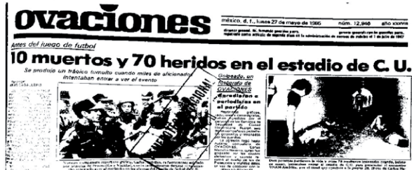
Fuente - Arias Caballero, Ángel, et al., Periódico Ovaciones, 27 de mayo de 1985. Hemeroteca Nacional