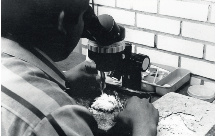
Imagen 6 Laboratorio del Centro Universitario de Investigaciones Biomédicas