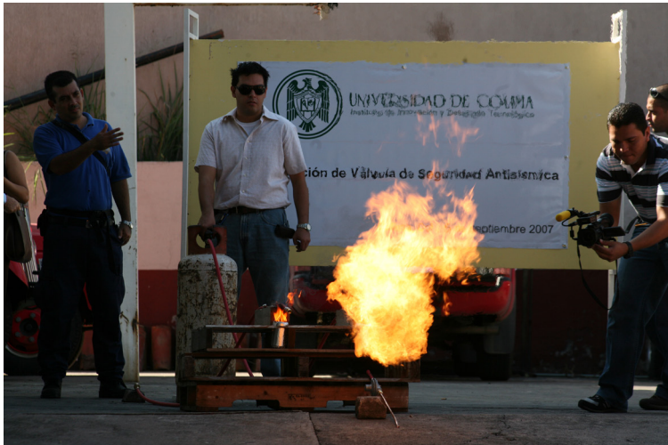
Imagen 15 Innovación y desarrollo tecnológico