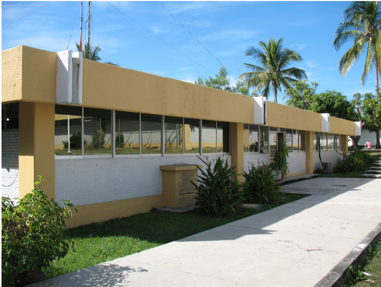
Imagen 21 Centro Universitario de Estudios Vulcanológicos