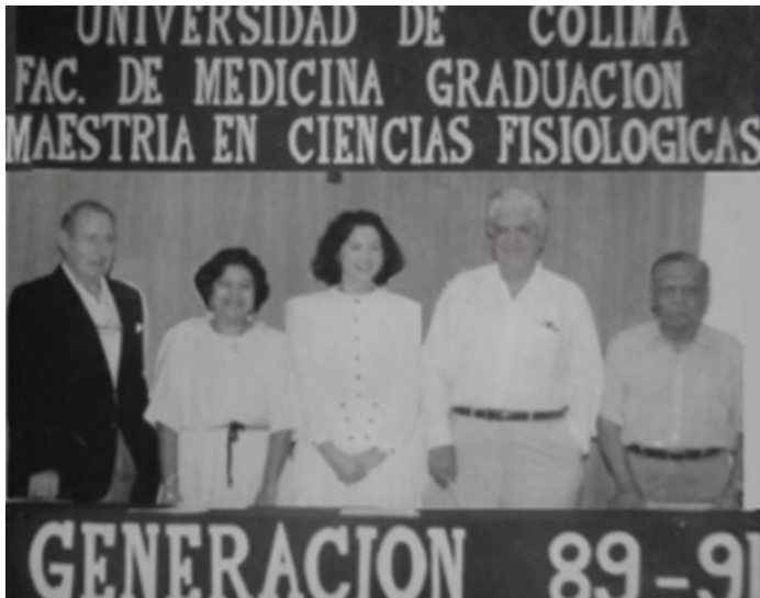
Imagen 5 Generación 1989-1991, ciencias fisiológicas, Facultad de Medicina.