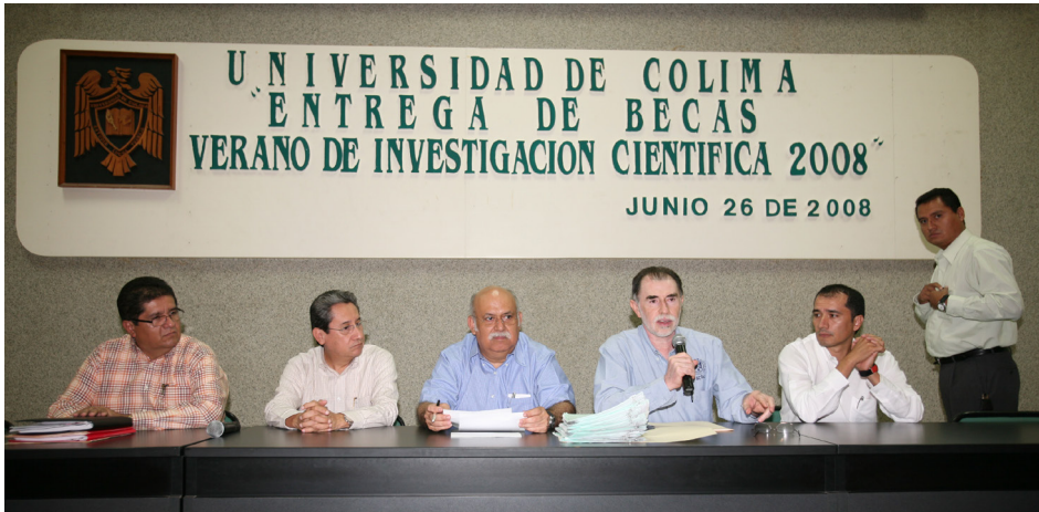
Imagen 10 Entrega de becas “Verano de Investigación Científica 2008”