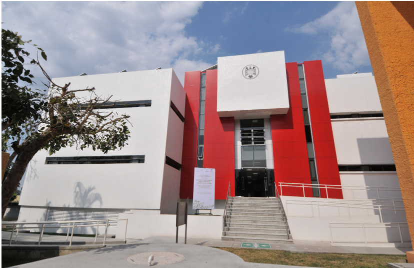
Imagen 24 Centro Universitario de Investigaciones Biomédicas