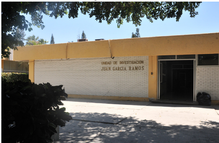
Imagen 20 Unidad de Investigación “Juan García Ramos”