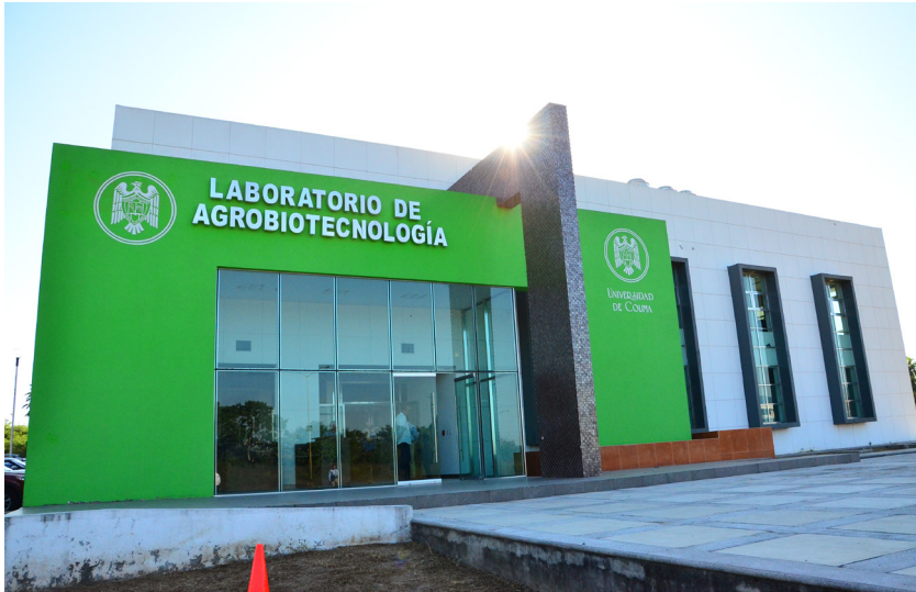
Imagen 23 Laboratorio Agrobiotecnología