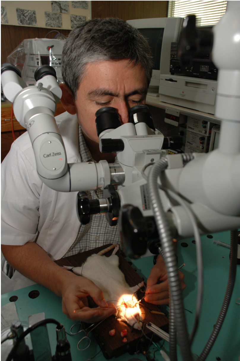
Imagen 16 Trabajo en laboratorio del CUIB