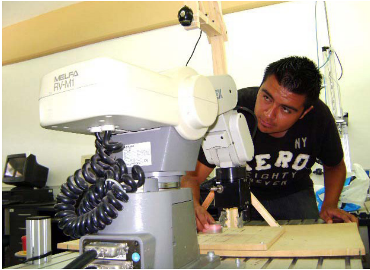
Imagen 14 Alumno en movilidad del Programa Delfín