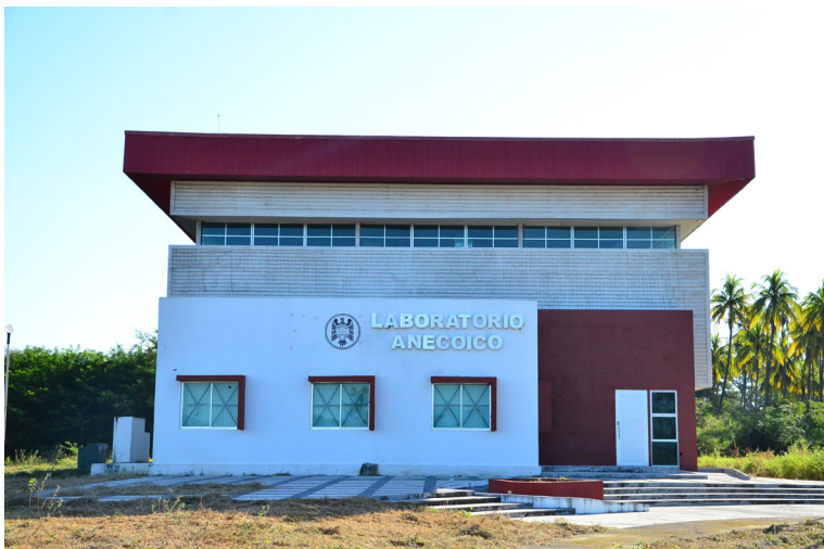
Imagen 22 Laboratorio Anecoico