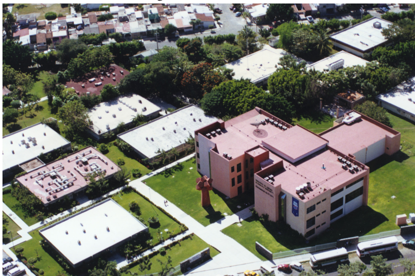
Imagen 19 Centros de investigación de la Universidad de Colima